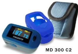
MD 300 C2